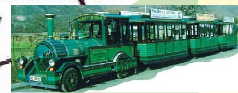
Jasto-Bahn mit Fahrtrichtung und Haltestelle